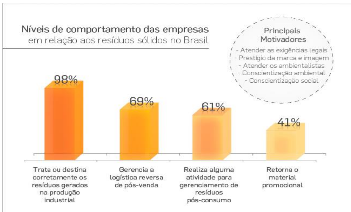
GRÁFICO 1- Níveis de comportamento das empresas em relação aos resíduos sólidos no Brasil