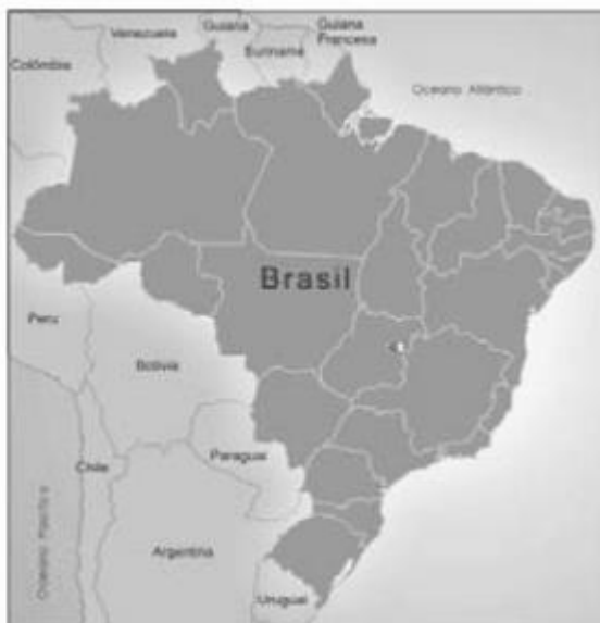
Figura 1 – Fronteiras do Brasil

compreensão (se houver). A ilustração deve ser citada no texto e inserida o mais próxima possível do trecho a que se refere. Tipo, número de ordem, título, fonte, legenda e notas devem acompanhar as margens da ilustração.